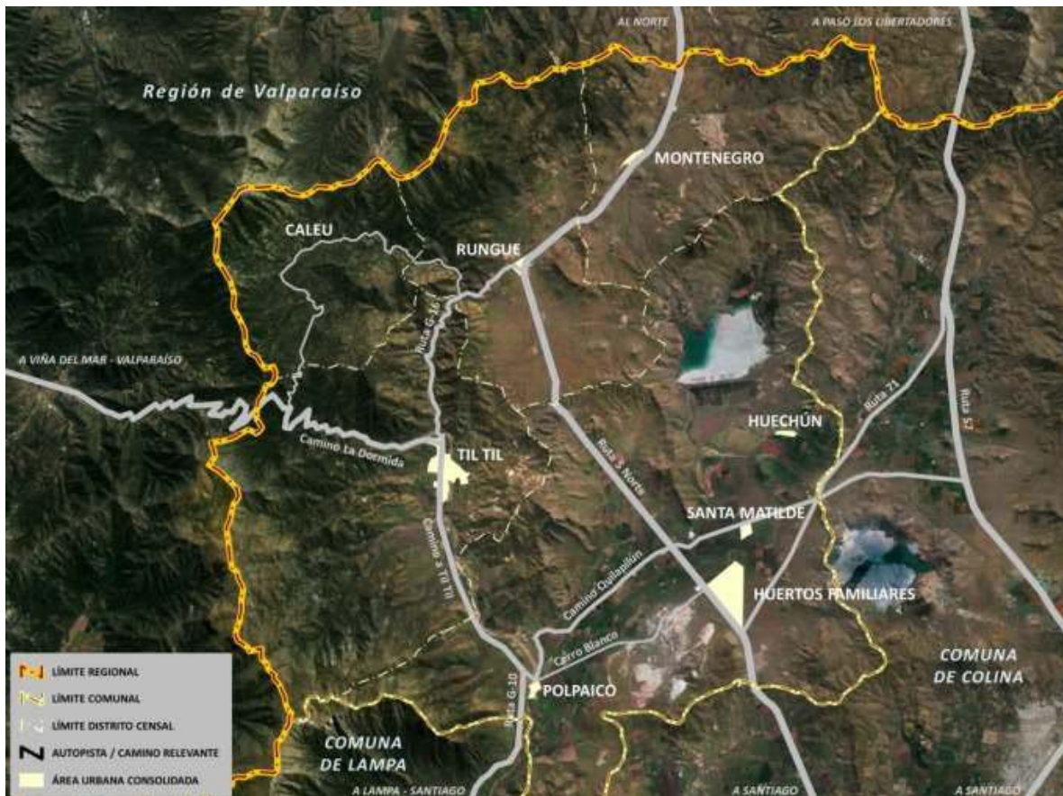
Figura 2. Mapa del territorio municipal de Tiltit y sus principales localidades.

Según proyecciones del Instituto Nacional de Estadísticas (INE) para el año 2012, la comuna posee una población de 16.558 habitantes, correspondiente al 7,91% de la población provincial (209.295 habitantes); del total de la población comunal, el 48% habita en asentamientos rurales. 10