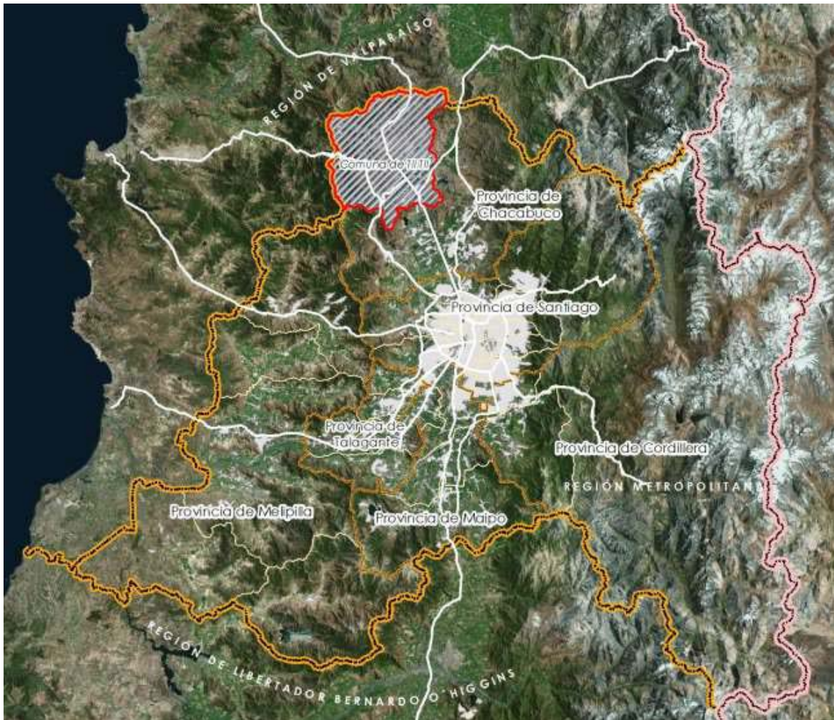
Figura 1. Comuna de Tilttil en el contexto de la Región Metropolitana y de la Provincia de Chacabuco.

La comuna de Tilttil está dividida en cinco distritos censales: Tilttil, Polpaico, Montenegro, Rungue y Caleu. Se reconocen solo dos áreas urbanas: Tilttil urbano y Huertos Familiares urbano; mientras que en el área rural se encuentran, entre otras, las siguientes localidades: Montenegro, Rungue, Caleu, Huechún, Santa Matilde y Polpaico. 9